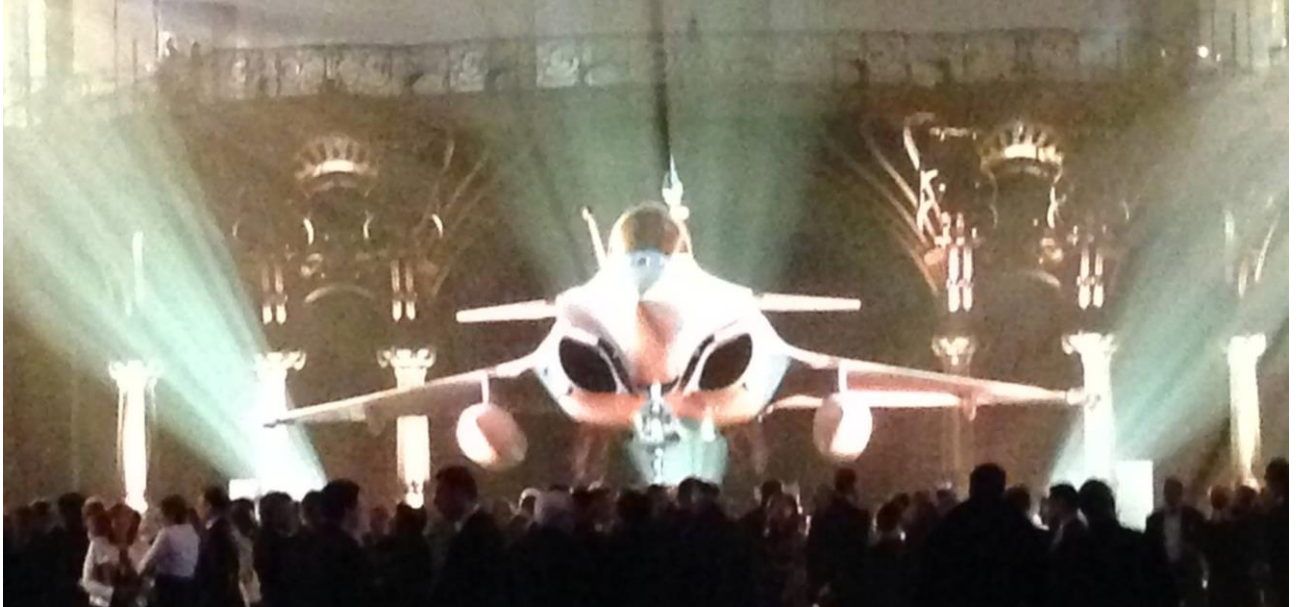
Dassault Havacılık 100'ncü Yıldönümü Kutlamaları @ Grand Palais - Paris, Fransa